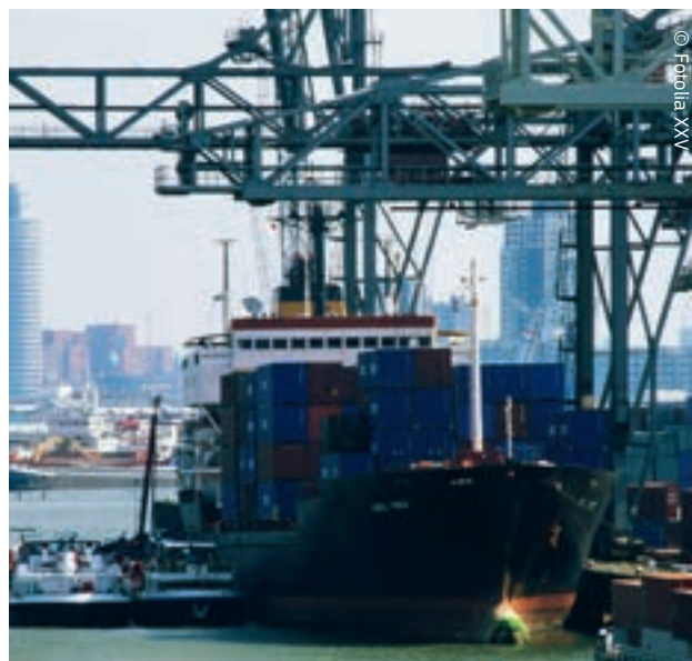
Port w Rotterdamie: okno na światowy handel.

Jednocześnie europejska polityka podatkowa ma na celu ułatwienie swobodnego przepływu osób, towarów, usług i kapitału. Komisja Europejska będzie kontynuowała prace nad usunięciem barier podatkowych utrudniających wolny handel w Europie i na całym świecie oraz w dalszym ciągu będzie wspierać zwiększanie wzrostu gospodarczego i dobrobytu w krajach UE.