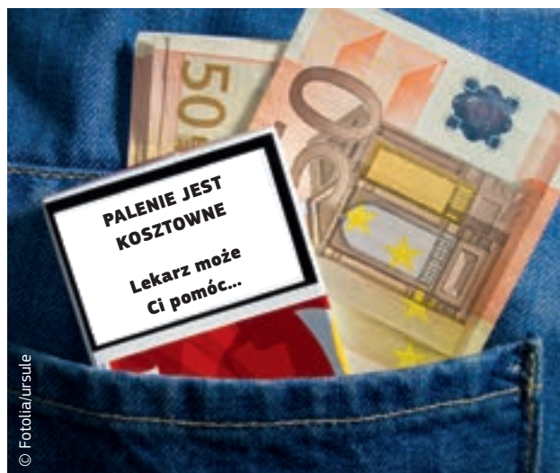
Pozytywne skutki uboczne: podatki akcyzowe od wyrobów tytoniowych mogą zachęcać ludzi do rzucenia palenia.