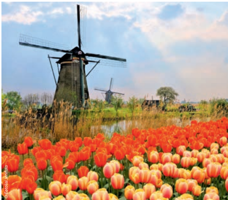
Rynek wewnętrzny w praktyce: Holandia eksportuje do innych krajów europejskich 630 mln cebulek tulipanów rocznie.

działają, co może prowadzić do bardzo wysokiego ogólnego poziomu opodatkowania. Problemu tego nie można rozwiązać, stosując aktualnie obowiązujące przepisy UE. Dlatego kraje UE muszą ściśle ze sobą współpracować. Porozumienie w sprawie uproszczenia niektórych przepisów podatkowych i wyeliminowania pewnych niewydolności mogłoby pomóc w zapewnieniu swobodnego przepływu towarów, usług i kapitału w UE.