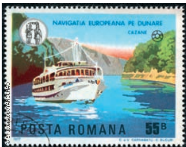
Podczas podróży statkiem po Dunaju z Niemiec do Rumunii można poznać różne krajowe systemy podatku VAT.